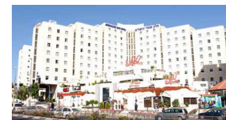
Jerusalem Gate Hotel in Jerusalem