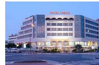
Inbar Hotel in Arad

Transfer zum Flughafen Ben Gurion und Rückflug nach Deutschland.