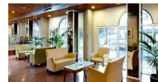
Prima Too Hotel in Tiberias